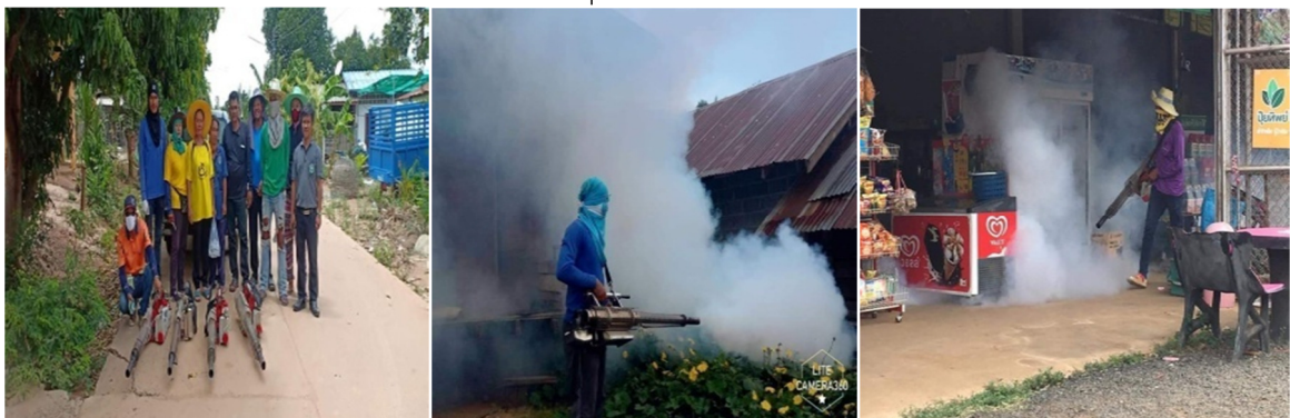
โครงการป้องกันโรคติดต่อต่างๆ (โรคไข้เลือดออก)